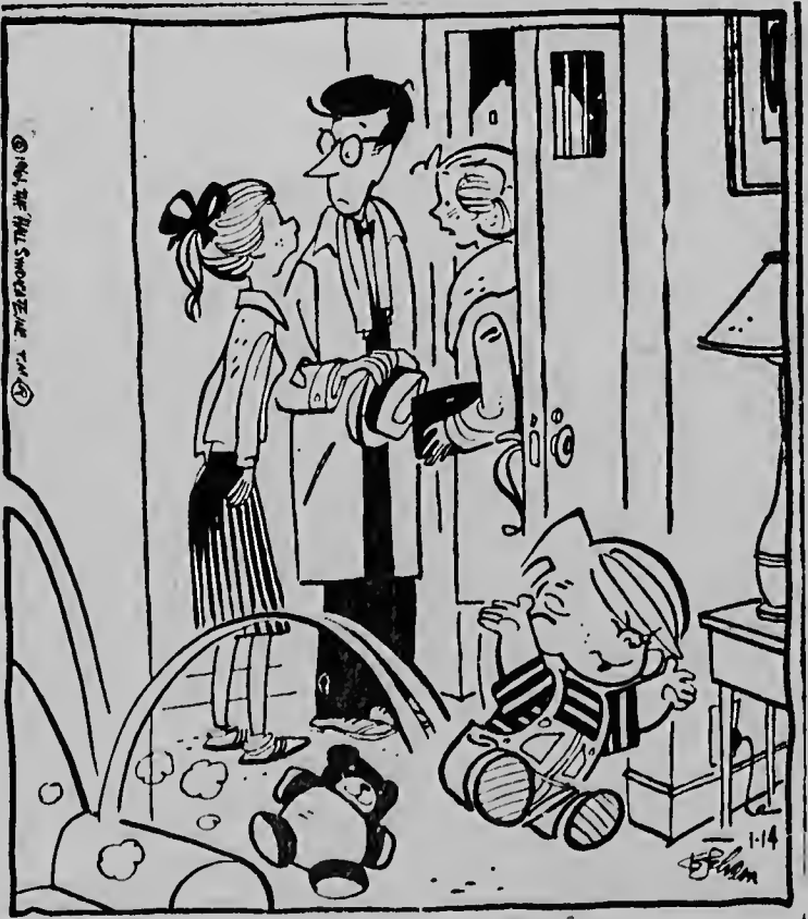
„Als hij brutaal wordt mag ik hem zeker een pak voor zijn broek geven, he?“

„Si e bira onbeschoft, mi por dune un aire di zota?“